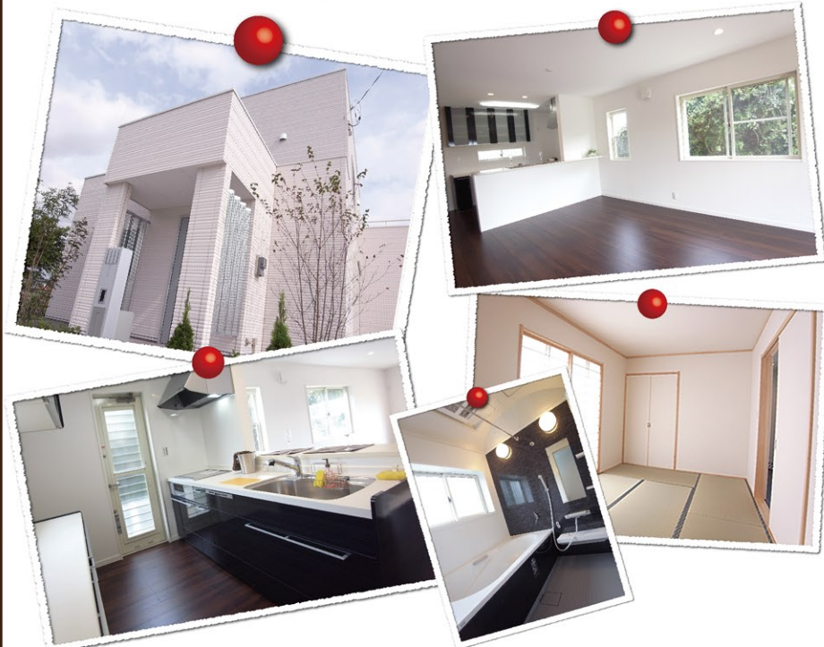
【新築住宅】◇価格/2,280万円(税込) ◇交通/JR外房線「大網」駅より1.4km ◇土地/206.25㎡(62.39坪) ◇建物/103.08㎡(31.18坪) ◇間取/4LDK(26年11月完成済) ◇所在/大網白里市大網 (売主)