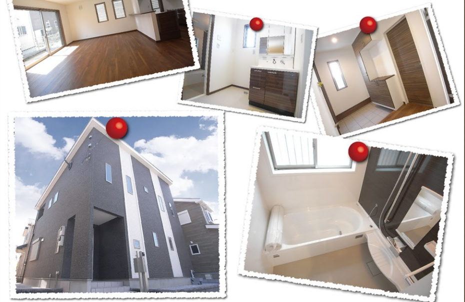
【新築住宅】◇価格/2,880万円(税込) ◇所在/大網白里市みどりが丘4丁目 ◇交通/JR外房線「大網」駅バス7分徒歩2分 ◇土地/181.44㎡(54.88坪) ◇建物/115.93㎡(35.06坪) ◇間取/4LDK+書斎(H27年3月完成済) (代理)

太陽光発電 10kW 搭載 経済産業省認定、固定価格買取制度 年平均売電価格:約40万円!! なんと20年間でトータル約800万円売電により、住宅ローンをかなり軽減することができます。