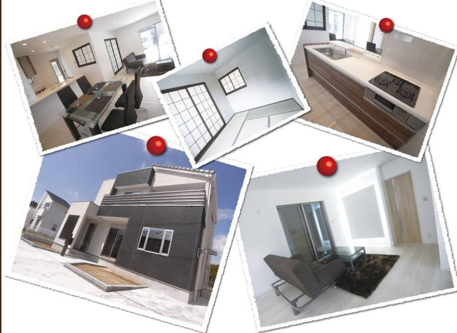
【新築住宅】◇価格/2,580万円(税込) ◇所在/大網白里市みどりが丘2丁目 ◇交通/JR外房線「大網」駅バス7分徒歩2分 ◇土地/184.58㎡(55.83坪) ◇建物/115.92㎡(35.06坪) ◇間取/4SLDK(H27年3月完成済) (売主)

concept YKKAP®居住空間デザイン室とのコラボレーションにより、シンプルデザインに和テイストを融合させたデザイン住宅。プライバシー確保と風通しの相反するテーマを解決し、室内は光と和を感じる演出が施されています。