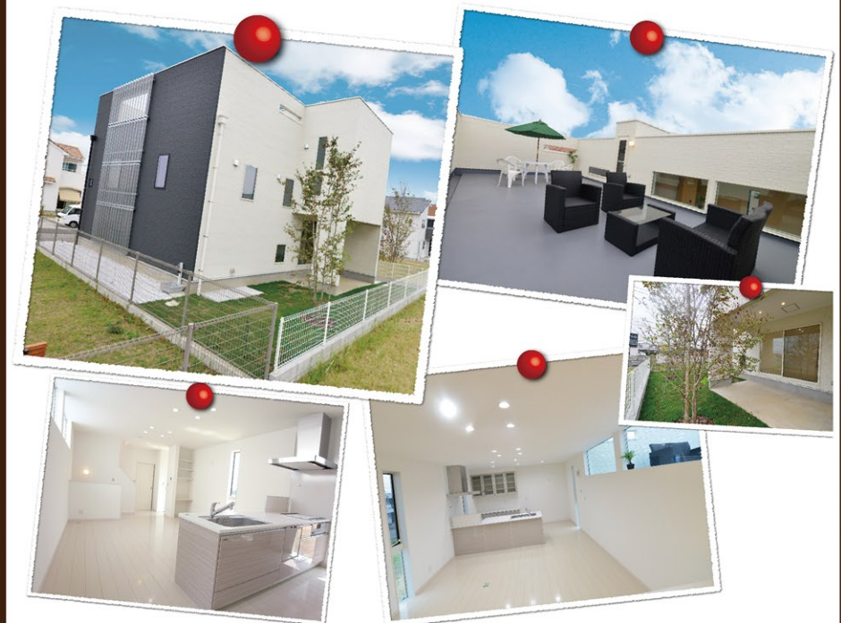
【新築住宅】◇価格/3,280万円(税込) ◇交通/JR東金線「東金」駅より1.7km ◇土地/201.79㎡(63.76坪) ◇建物/117.64㎡(35.51坪) ◇間取/4SLDK(H26年7月完成済) ◇所在/東金市市田間 (売主)